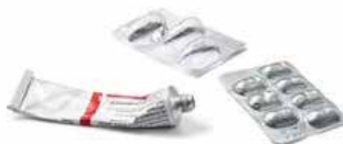
Tubes de crème Plaquettes et blisters de médicaments