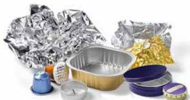
Capsules café, Bougies chauffe-plat, Barquettes, Boîtes et Feuilles