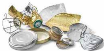
Bouchons, Capsules, Couvercles, Opercules, Collerettes et Couronnes