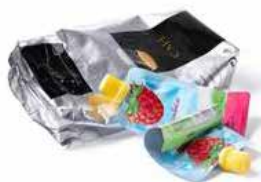
Sachets café Poches de compote